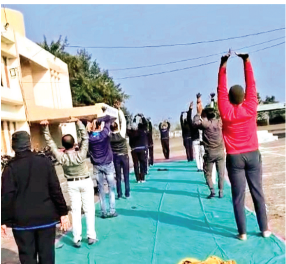
नलखेड़ा