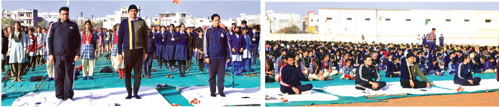
नलखेड़ा

स्वामी विवेकानंद के जन्मदिवस राष्ट्रीय युवा दिवस के उपलक्ष्य में जिले के नागरिकों द्वारा स्वस्थ तन और मन के लिए आनंद एवं उत्साह से परिपूर्ण होकर सूर्य नमस्कार किया गया। जिले की शैक्षणिक संस्थाओं, महाविद्यालयों एवं छात्रवासों में विद्यार्थियों द्वारा कतारबद्ध होकर प्रार्थना मुद्रा, हस्त उत्तानासन, पादहस्तासन, अधःसंचालन, पर्वतासन, अष्टांग नमस्कार, भुजंगासन कर सूर्य नमस्कार के आसनों को 12 स्थितियों के क्रम को दोहराया, साथ ही अनुलोम, विलोम, भ्रंशिका एवं भ्रामी प्राणायाम कर सभी ने योग के माध्यम से स्वस्थ रहने का संकल्प लिया।