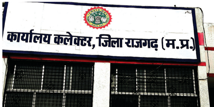
कार्यालय कलेक्टर, जिला राजगढ़ (म.प्र.)